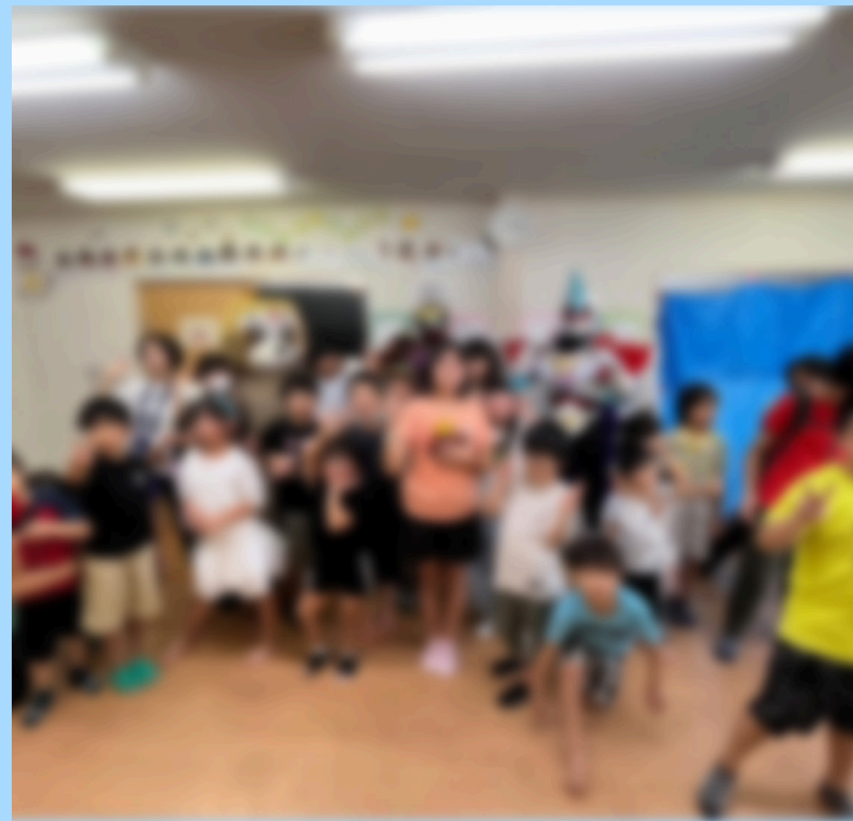
ヒーローショー（ころたまん）