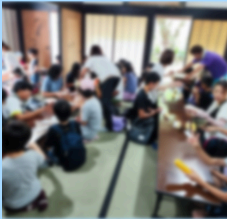
まがりや（沼田市田舎体験）

全事業所が集まり、各事業所で行っている支援などを月一回会議を開催し共有しています。また、社内研修や委員会会議も行い、職員全員が支援に対しムラができないよう努めています。外部研修にも積極的に参加し、研修に参加しやすい職場環境づくりを心掛けています。